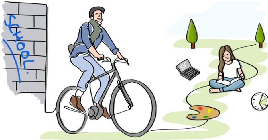
ONDERWIJS BUITEN DE SCHOOLMUREN: LEERKRACHT OP DE FIETS